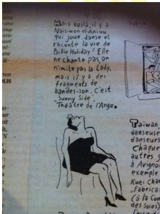
le croquis de Willem Journal Libération